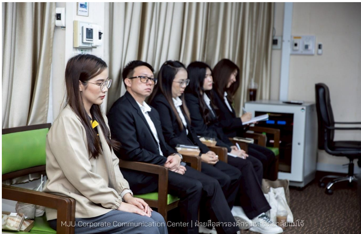
MJU Corporate Communication Center | ฝ่ายสื่อสารองค์กร มหาวิทยาลัยแม่โจ้