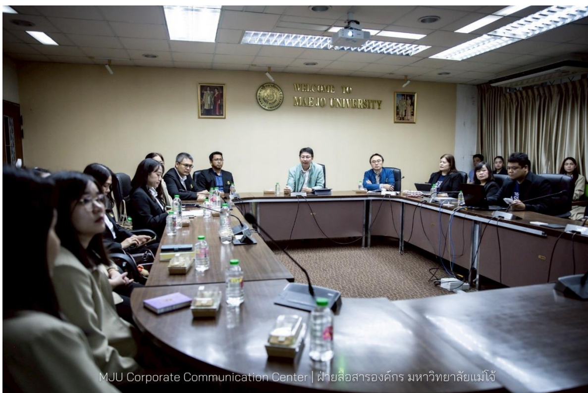
MJU Corporate Communication Center | ฝ่ายสื่อสารองค์กร มหาวิทยาลัยแม่โจ้